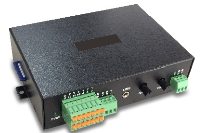
AR-2120 Audio repeater

Le programme est très flexible car 1 programme peut être attribué du lundi au vendredi, 2 programmes assignés au samedi et au dimanche, le programme 3 pourra servir pendant la période des vacances.