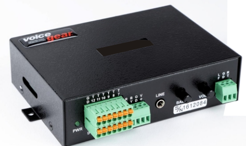
AR-212 Audio repeater